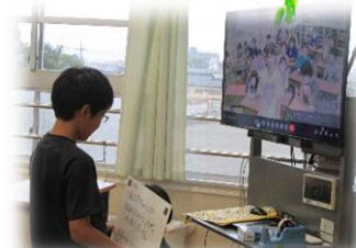
<オンラインでの意見交流>

今回の「いじめ防止会議」は、南中生徒会のリーダーシップのもと、学区の小中学生が「いじめ防止」を自分事として考える大変貴重な機会でした。これからも誰もが安心して、自分らしく生き生きと過ごせる学校、学区を目指します。